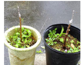
モモを台木にスモモ接ぎ木