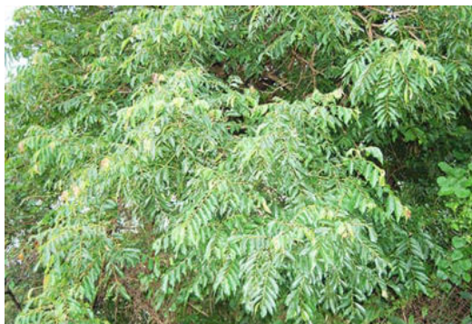
枝はしだれることが多い

和名は台湾の地名に由来する。沖縄ではカキバカンコノキ、ケカンコノキ、キールンカンコノキと3種とも似ているが、キールンの葉は葉の付け根の葉脈が非対称になる。ケカンコノキは葉裏に毛が密生するので区別がつく。ケカンコノキは沖縄島中南部では稀。カキバカンコノキは湿気のある場所を好む傾向がある。