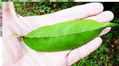
葉の付け根の脈は非対称