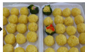
黄色に染めたごはん