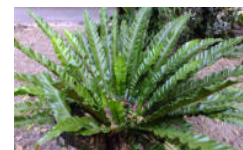
ヤエヤマオオタニワタリ