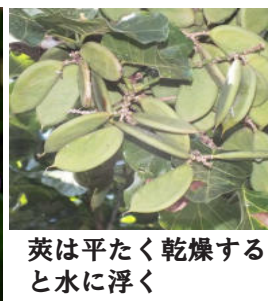
莢は平たく乾燥すると水に浮く