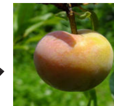
接ぎ木成功後、実ったスモモ