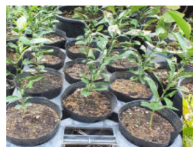
シークワサーの苗

ハイビスカス類 台木に使う品種はブッソウゲ、八重咲き赤(ダブルレッド)、受咲き(ペインレッドレディー)を挿し木で育てて使用します。