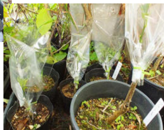
ミカン類の接ぎ木