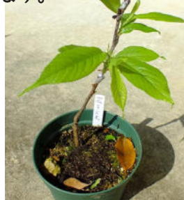
クメノサクラ接ぎ木