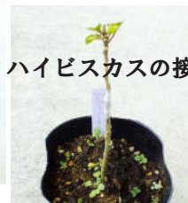
ハイビスカスの接ぎ木