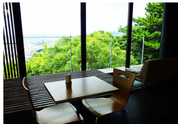
海に見えるテラス