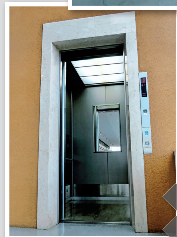
第19回 高校・高等専門学校部門 金賞【紫雲出山の陰と陽】