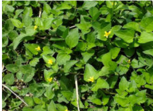
ツルセンダングサ