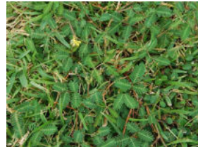
オカミズオジギソウ