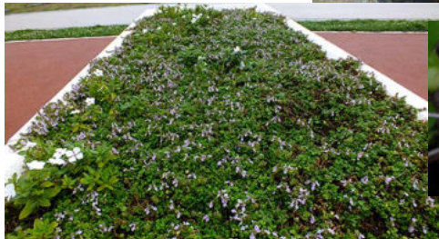
花壇に群生させることが出来る