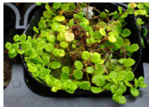
成長したら鉢を大きくする