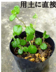
用土に直接挿し木