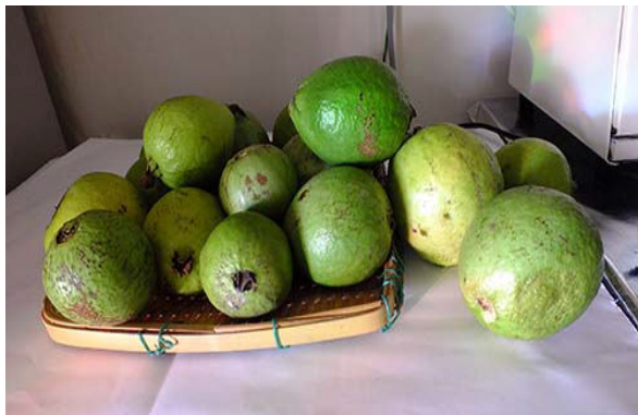
収穫後、追熟させる

高さ 2-8m に成長する常緑の小高木。花は初夏に咲き白。果実は楕円形～球形、熟すと甘くなる。果肉が白、赤。ピンクと品種が栽培されていて、時に野生化している。導入された当初は葉を健康茶として利用するためと考えられていたが、近年果実も美味しいことから家庭果樹として盛んに栽培されてきた。ところが、生活が豊かになり最近では生食利用が減ってきている。葉をお茶としての利用は健康ブームもあり、愛用者も増えてきていて、製品が販売もされている。