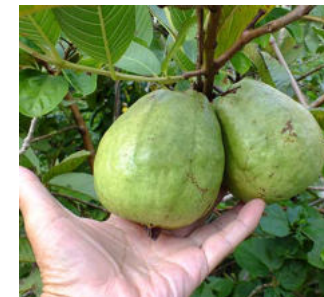
サラダ用実大きい