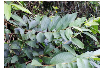
葉は収穫後乾燥させてお茶にする