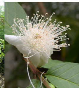
花は初夏に咲き白い