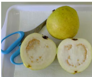
中味が白 出荷用として栽培