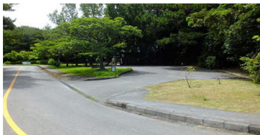
パークゴルフ場駐車場