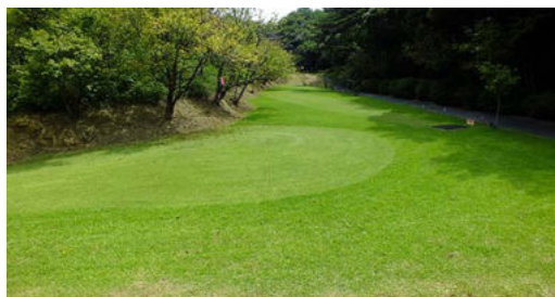
手入れの行き届いた芝生