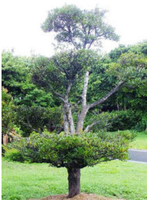
好みの樹形にできる