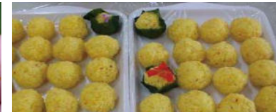
クチナシ染めごはん