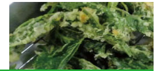
シマグワの天ぷら