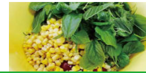
シマグワのサラダ