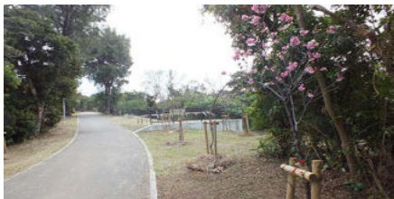
毎年植栽され数が増えている