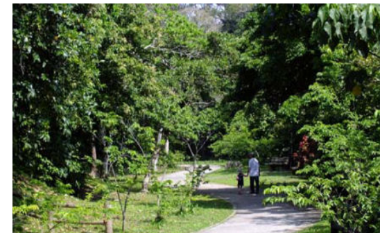
牧港川沿いの葉サクラ中の散歩