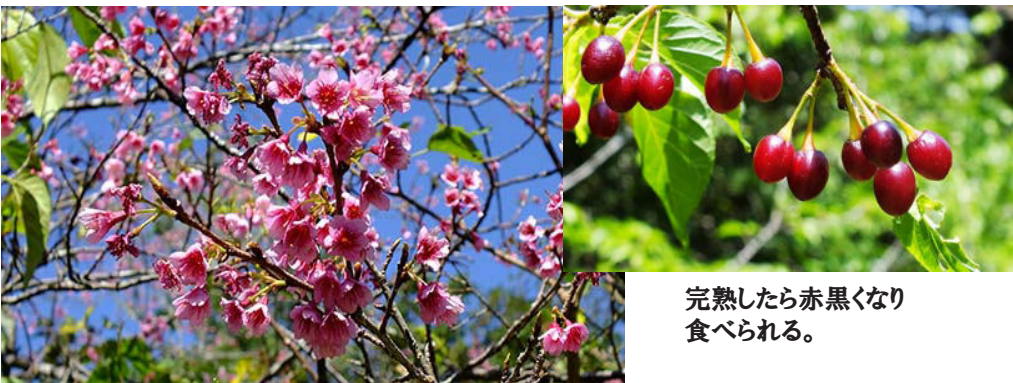
青空にはえるカンヒザクラの花

果実は赤黒く熟し、食べると甘味もあるが渋い。果実を泡盛等のアルコールにつけると、きれいなピンク～赤色になるので、色を使った様々な食材の色付けに使われる。