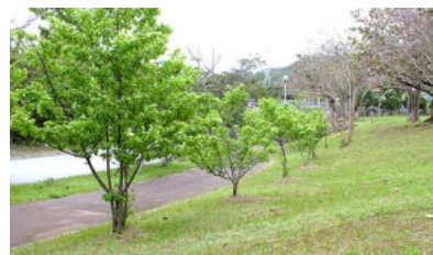
市道沿いのサクラ、散策者に人気だ