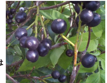
完熟した実は食べられる