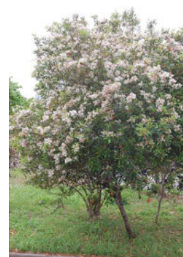
満開の花は見ごたえがある