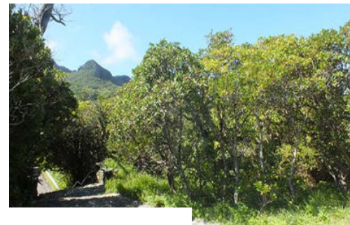
植栽され育った木