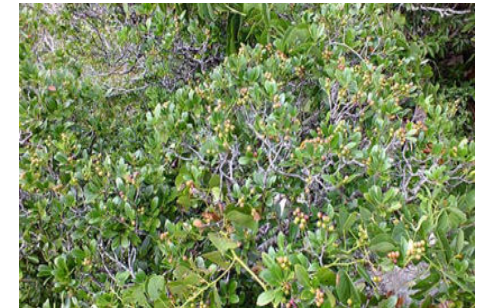
風衝地では樹高が低く、葉も厚く小さくなる。