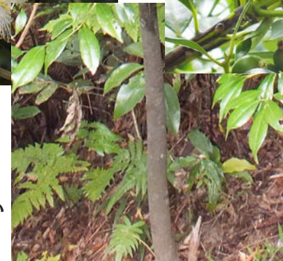
名前の由来にもなっている黒い樹皮