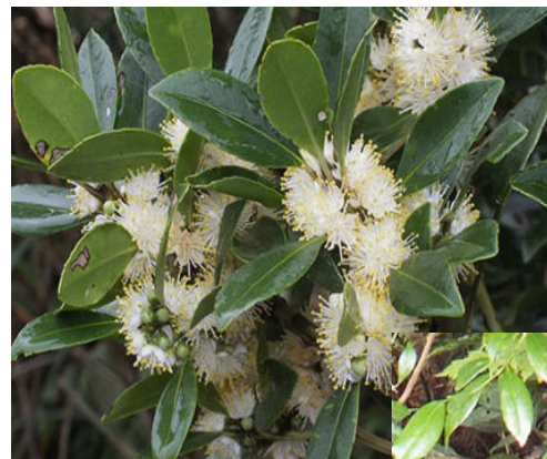
低温期に咲く白い花、芳香がする。