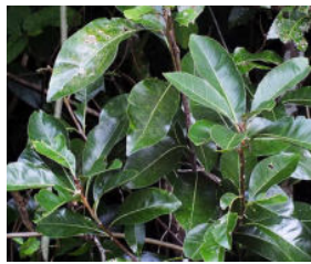
葉の表面はてかる