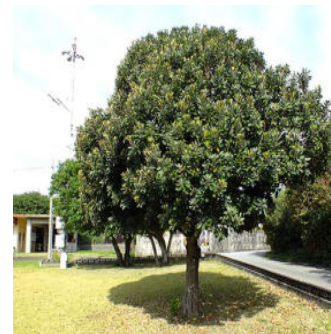
校庭に植えられ、樹形が良い 北大東島