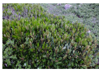
風衝地の葉は硬く小さい