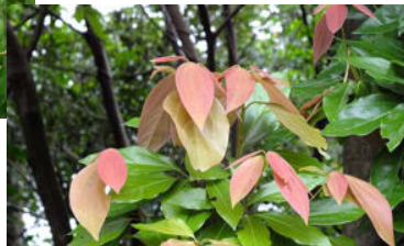
シロダモ 稀に幼虫はいる