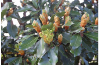
タブノキ 卵・幼虫がよく見つかる

青緑色の翅を持つ美しいアオスジアゲハは3～11月まで園内を飛び回っています。発生を支えているのは幼虫が食べる食草のクスノキ科植物が豊富に生えているからです。食草(食樹)の紹介です。