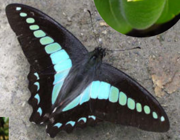
成虫の翅は美しい