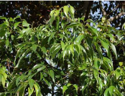
ニッケイ 鉢植えても幼虫はよくつく