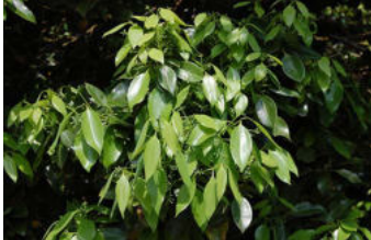
ヤブニッケイ新葉の時 に幼虫はよく見つかる