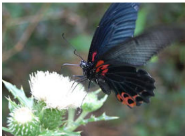
シマアザミに訪花 ♂

最近、沖縄でも異変が起きている。台湾にいる雌に尾がある「有尾型」が、2006年に沖縄本島で記録され、その後北部各地で捕獲されている。とうとう名護城公園内でも一昨年捕獲されたようだ。