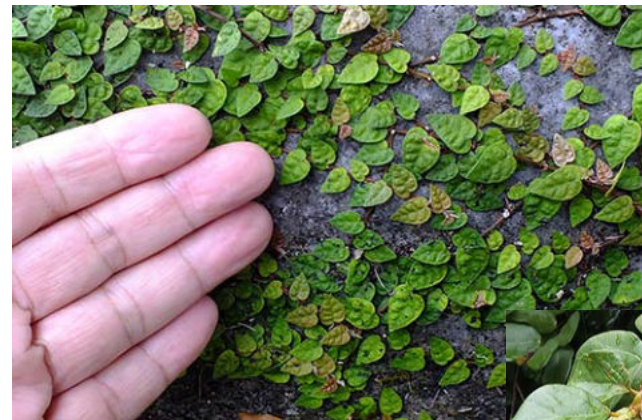
壁に這うオオイタビ 殺風景な壁を緑の葉で覆うことができる