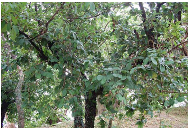
壁や樹木に這いあがり生育する

常緑のつる性木本で雌雄異株です。樹木、岩、壁に張り付いて生育します。壁面緑化、観葉植物（フィカス・ブミラ）に利用されています。雄果実は、イチジクコバチの幼虫が食べて育つ食料です。雌果はぎゅーりと実がつまっています熟すと黒砂糖のように甘いです。鳥やコウモリが食べ、種子が散布されると考えられています。雌果実は熟すと黒糖のような濃厚な甘さがあり、とっても美味しい。そのため、見つけた場所は秘密にしていたと伝えられています。