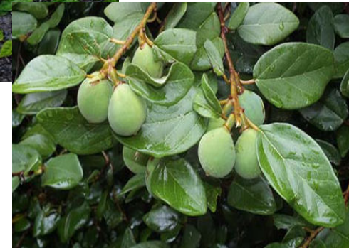
雌果実の実つきの様子