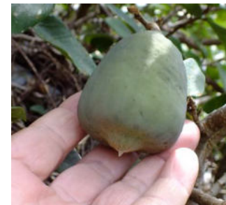
雄果実 食べられない