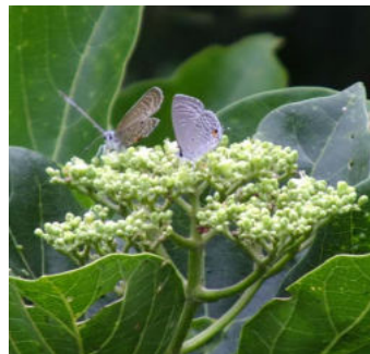
クロマダラソテツジミ