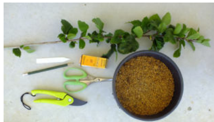
挿し木に使う道具と材料