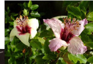
ハイビスカスの原種・インスラリス