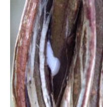
傷をつけると白いネバナバの樹液がでる