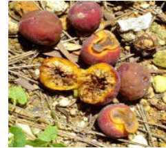
果実はイチヂク状