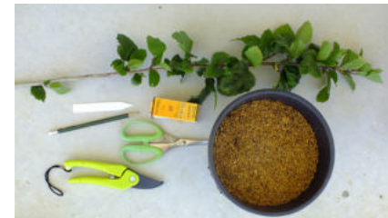
挿し木に使う道具と材料