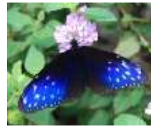
ツマムラサキマダラ

大雨等の場合は延期が中止。 実施の様子を撮影し、報告書や今後の資料に使う事があります。